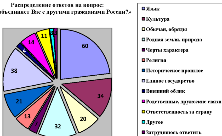
Рис. 2. Распределение ответов на вопрос: «Что объединяет Вас с другими гражданами России?» (в процентах, n = 1042 )

Примечание. Ответы на вопрос предполагали многовариантность, поэтому сумма ответов больше 100 %.